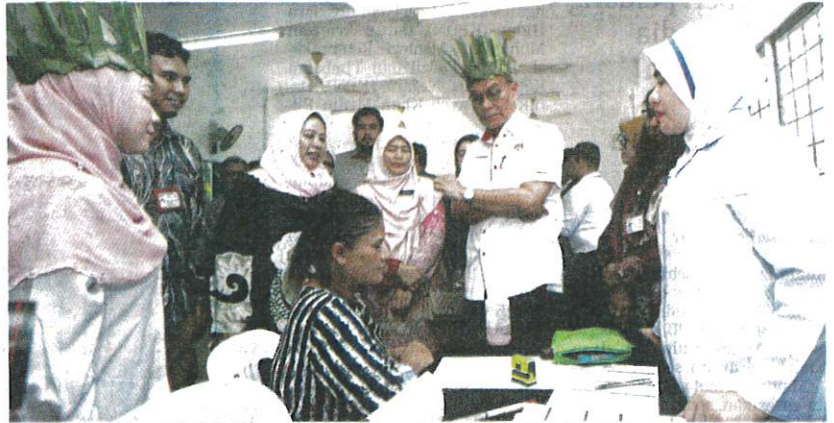
Dr Dzulkefly melawat Klinik Kesihatan Rasa di Kampung Orang Asli Tun Abdul Razak Batang Kali, semalam.