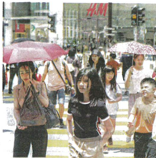
ORANG ramai perlu melindungi diri daripada cuaca panas bagi mengelakkan penyakit berkaitan kulit. – GAMBAR HIASAN

Beliau berkata, berdasarkan ramalan MetMalaysia, cuaca panas disebabkan fenomeba El Nino akan mula melemah pada Julai berikutan kemunculan fenomena La Lina.