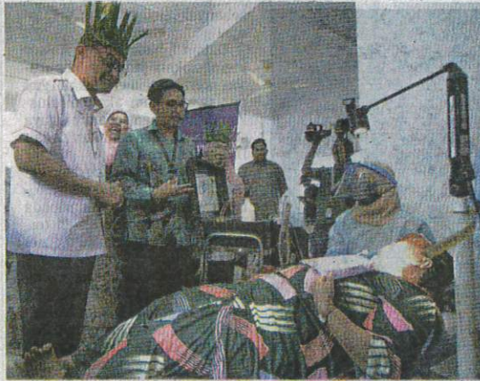
DZULKEFLY Ahmad melawat seorang penduduk Orang Asli yang menjalani pemeriksaan gigi di Kampung Orang Asli Tun Abdul Razak, Kuala Kubu Bharu, semalam.

"Semua tahu ada kesan sampingan dan kita dalam Kementerian pun ada garis pan-