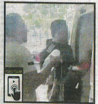
Video tular di media sosial menunjukkan seorang lelaki menghantar ahli keluarganya menaiki ambulans ke hospital dipercayai akibat keracunan makanan.

"Kita sudah ambil beberapa sampel makanan dan bahan digunakan," ujarnya. Baru-baru ini, tular video menunjukkan seorang lelaki menghantar ahli keluarganya menaiki ambulans ke hospital dipercayai akibat keracunan makanan.