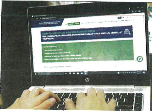
PENGGUNAAN vaksin AstraZeneca digunakan secara meluas untuk mengekang penyebaran wabak Covid-19. – GAMBAR HIASAN

AKHBAR : KOSMO MUKA SURAT : 13 RUANGAN : NEGARA